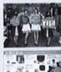
▲搭配週年慶促銷與DM宣傳