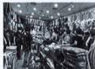
圖三、111年大口吃萬華美食祭展售攤位及服飾商團導讀