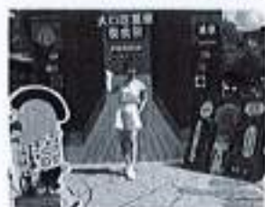
圖二、美食廣告看板及活動大使